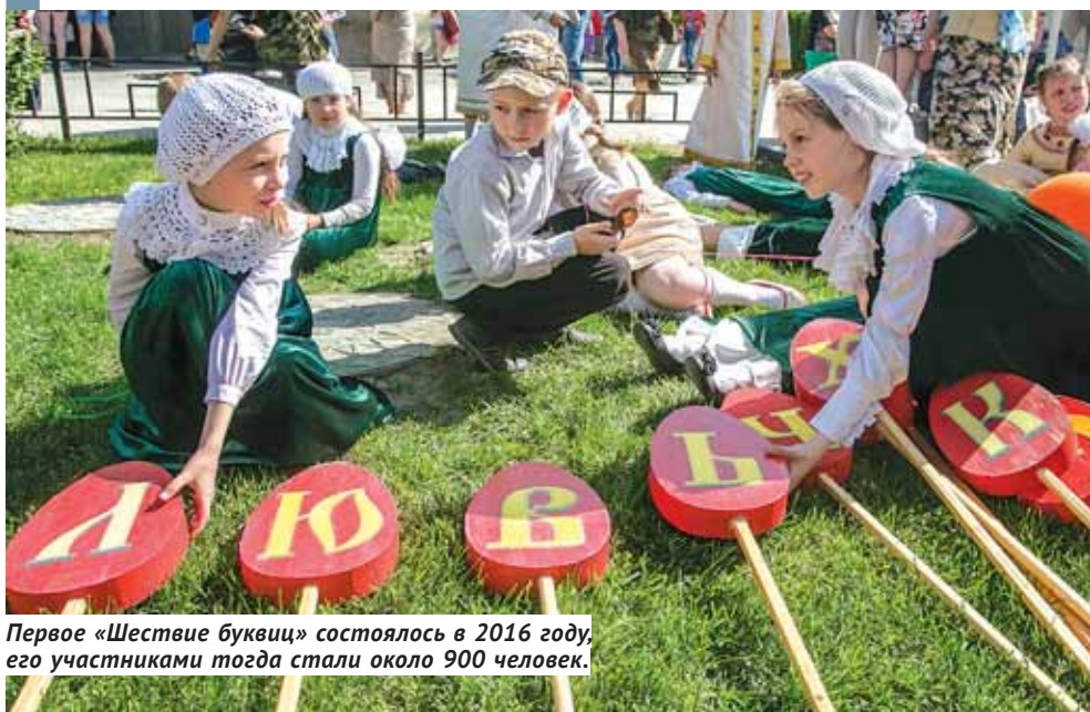
Первое «Шествие буквиц» состоялось в 2016 году, его участниками тогда стали около 900 человек.