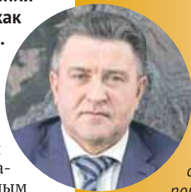
Андрей ШИМКОВ, председатель Законодательного собрания Новосибирской области:

— Новосибирск зарождался как огромный транспортный узел, поэтому любой из видов транспорта для нас имеет огромное значение. В новых указах президента огромное внимание было уделено развитию дорожной сети регионов, а Новосибирская область — это более 12 тысяч километров только региональных дорог. В масштабах страны на строительство и обустройство автодорог в ближайшие шесть лет планируется направить 11 триллионов рублей.