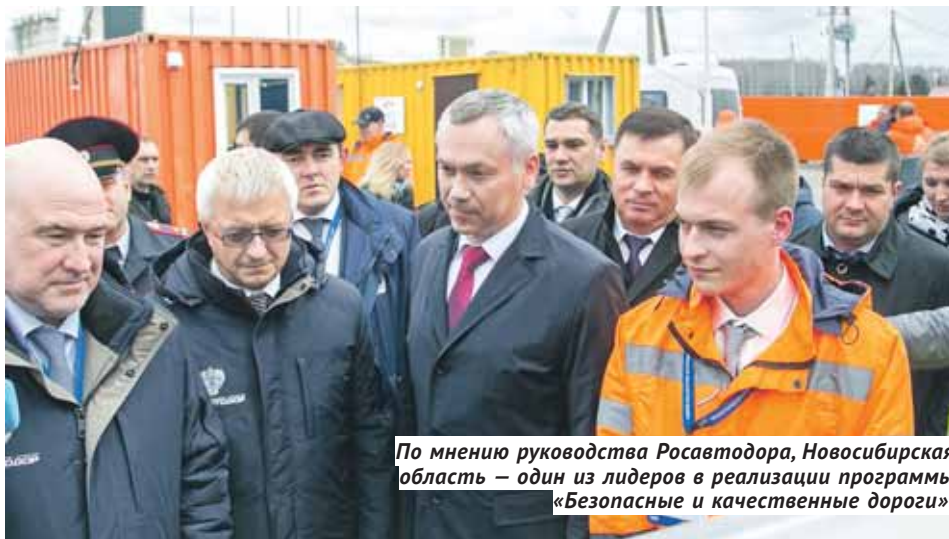
По мнению руководства Росавтодора, Новосибирская область — один из лидеров в реализации программы «Безопасные и качественные дороги».

— Новосибирск зарождался как огромный транспортный узел, поэтому любой из видов транспорта для нас имеет огромное значение. В новых указах президента огромное внимание было уделено развитию дорожной сети регионов, а Новосибирская область — это более 12 тысяч километров только региональных дорог. В масштабах страны на строительство и обустройство автодорог в ближайшие шесть лет планируется направить 11 триллионов рублей.