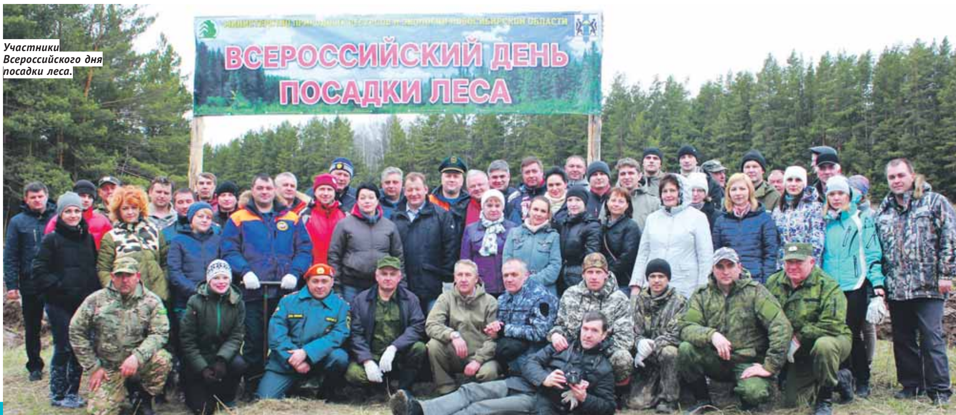
Участники Всероссийского дня посадки леса.

Виталий ЗЛОДЕЕВ / Фото предоставлено пресс-службой министерства природных ресурсов и экологии НСО