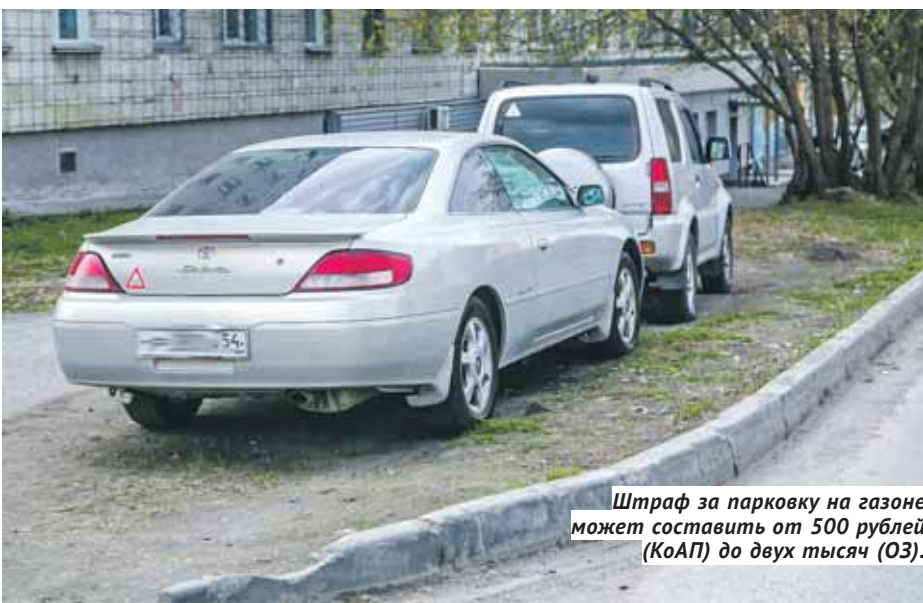
Штраф за парковку на газоне может составить от 500 рублей (КоАП) до двух тысяч (ОЗ).

ПЕРВОЕ ЧТЕНИЕ Чтобы получить компенсацию расходов на оплату жилого помещения и коммунальных услуг, льготникам не надо будет предоставлять пенсионное удостоверение.