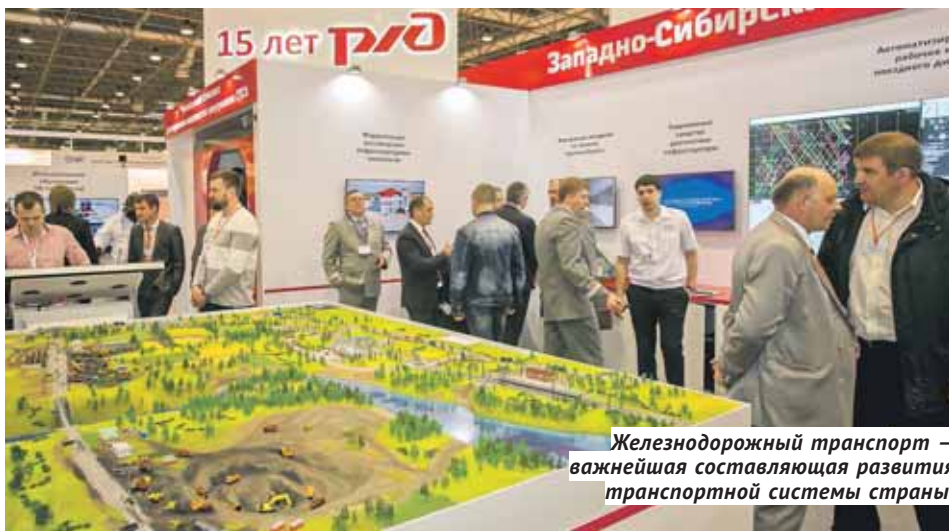
Железнодорожный транспорт — важнейшая составляющая развития транспортной системы страны.

Ещё одной из задач, поставленных президентом в рамках развития транспорта в России, стало увеличение до 50% в течение