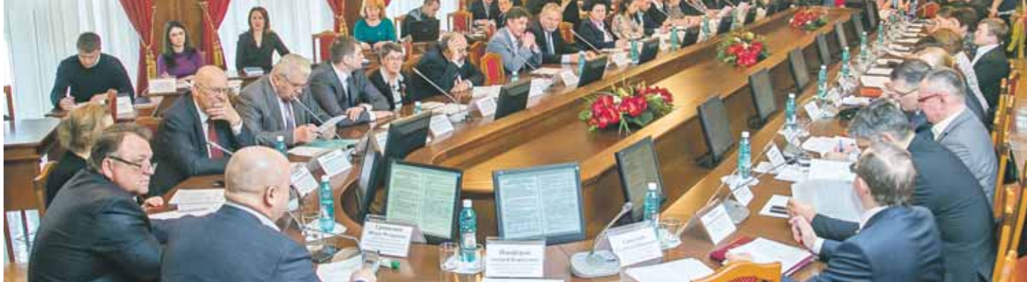
Круглый стол по льготным земельным участкам проходил с полным аншлагом.

ходимо не менее 150 миллионов рублей в год. Есть ещё 1 300 участков, которые можно было бы выделить многодетным семьям, но тогда понадобится ещё 147 миллионов рублей в год. Между тем в прошлом году на эти цели было выделено всего 10 миллионов рублей, на 2018 год было запланировано 20 миллионов. В таких условиях обеспечивать льготников инфраструктурой невозможно, подчеркнул главный архитектор, — на один участок требуется от 500 до 800 тысяч рублей только на инженерную часть, а если включить сюда транспортную и социальную составляющие, то получится около 2 миллионов.