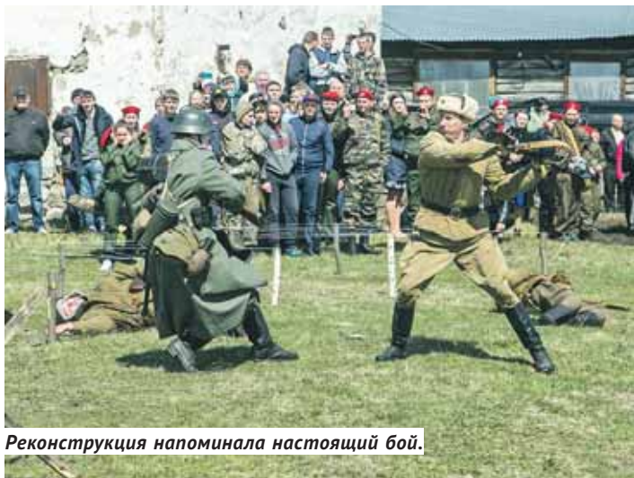
Реконструкция напоминала настоящий бой.

— Очень хорошо, когда инициатива простых людей обретает жизнь, находя поддержку на всех уровнях, — отметил Александр Аксёненко. — Такие памятники могут появиться только совместными усилиями. Ребята, глядя на него, будут помнить, что в их селе жил такой герой, который показывал своим примером, как надо любить Родину и от чего отталкиваться в жизни.