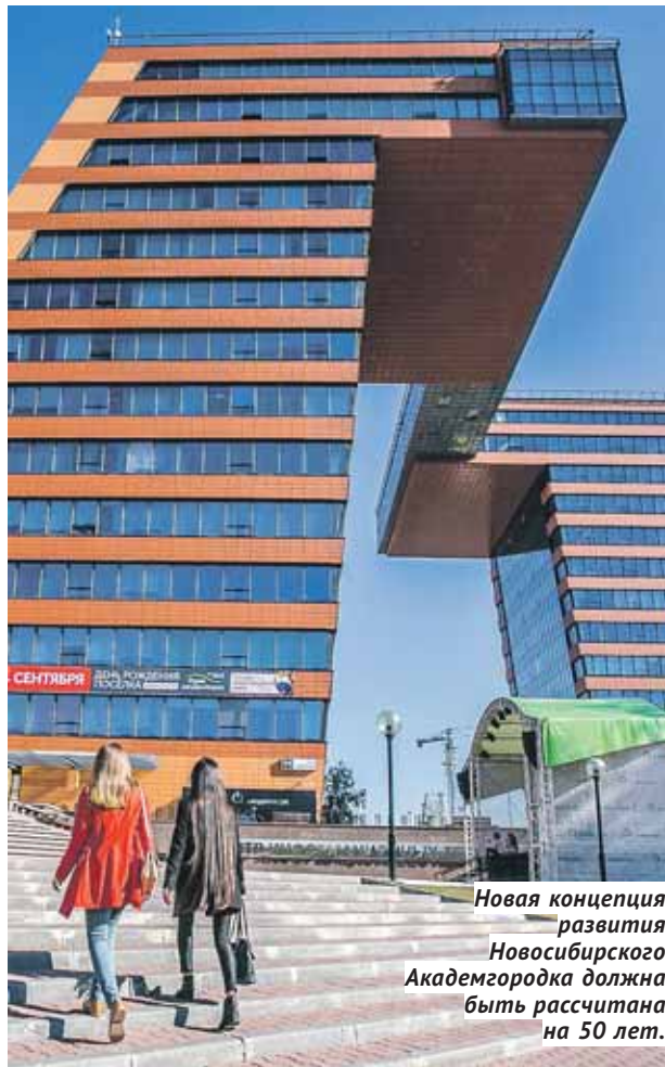
Новая концепция развития Новосибирского Академгородка должна быть рассчитана на 50 лет.