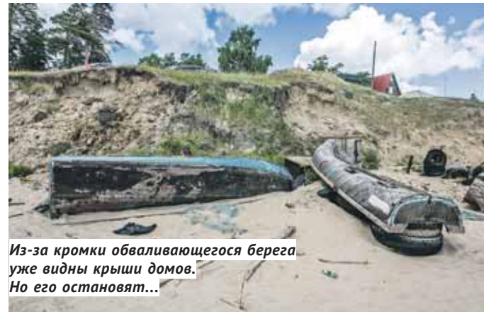
Из-за кромки обваливающегося берега уже видны крыши домов. Но его остановят...

На последнем заседании комитета врио министра природных ресурсов и экологии Новосибирской области Александр Дубовицкий заявил, что вопрос по Красному Яру практически решён: получено положительное решение госэкспертизы, и документ сегодня ждёт только одной, самой главной, подписи — премьер-министра РФ Дмитрия Медведева . Вопрос находится на личном контроле у врио губернатора Андрея Травникова , и если он будет решён положитель-